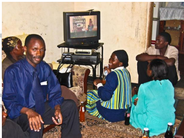
Gastfamilie in Uganda

mer. Auf Alters- und Berufsgruppen wird bei der Vermittlung auf Wunsch möglichst Rücksicht genommen. Auch reine Frauenhaushalte können vermittelt werden. Wir vermitteln auch Paare oder kleinere Gruppen. Wünsche dieser Art vermerken Sie bitte auf dem Anmeldebogen. Wir werden uns bemühen, sie zu berücksichtigen, können es aber nicht garantieren.