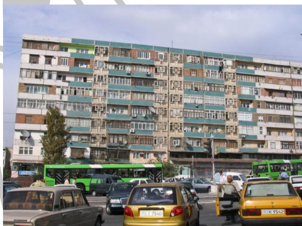
Plattenbau in Taschkent, wie überall in der GUS

Am Ende finden Sie einige landeskundliche Informationen, eine Literaturliste, eine Kurzinformation über den Verein und das Anmeldeformular. Aus Gründen der Lesbarkeit wird im Folgenden auf die Endung „-Innen“ verzichtet.