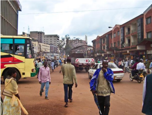
Innenstadt von Kampala

Hungerkatastrophe, Uganda ist dennoch eines der ärmsten Länder der Erde.