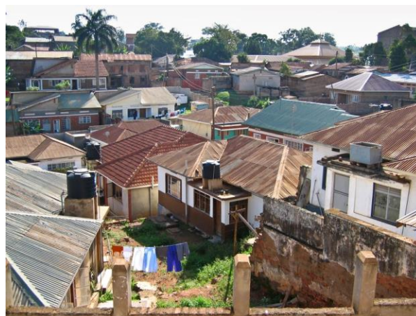
Wohnviertel in Kampala, Uganda

Die Gastfamilien gehören der dortigen Mittelschicht an. In vielen Fällen handelt es sich um Familien von (Deutsch-)Lehrern oder Studierenden, somit haben interessierte Lehrer aus Deutschland auch die Möglichkeit, über ihre Gastgeber ein anderes Bildungswesen kennen zu lernen. Sollten Ihnen die Deutschkenntnisse nicht wichtig sein und möchten Sie lieber in der Landessprache kommunizieren, vermerken Sie es bitte auf dem Anmeldeformular.