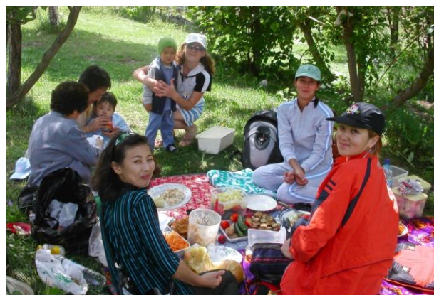
Picknick in den kirgisischen Bergen

In der Regel nimmt man zwei bis drei Mahlzeiten bei den Gastgebern ein. Eine weitere Mahlzeit bekommt man preiswert in der Stadt.