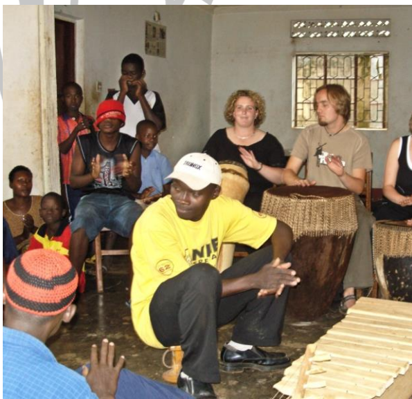
Trommel-Workshop in Uganda

Exkursionen mit oder ohne Betreuer in fernere Orte müssen extra bezahlt werden. Der Preis richtet sich nach der Teilnehmerzahl. Die Organisatoren vor Ort können Ihnen weitere Tipps für Ausflüge geben und bei der Planung helfen.