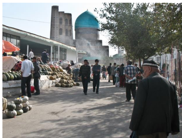
Basar in Samarkand

Den Teilnehmern in Russland, Kirgistan und der Mongolei empfehlen wir, sich vorher schon mit der kyrillischen Schrift vertraut zu machen und ein paar landessprachliche Ausdrücke für den Alltag zu lernen.