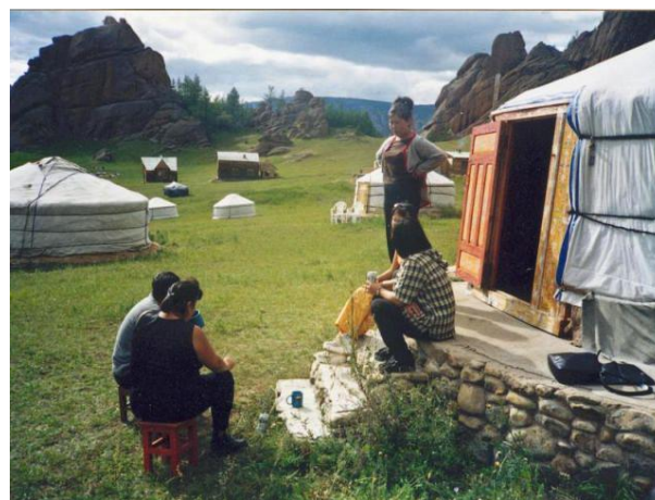
Ausflug aufs Land mit der Gastfamilie

Ausdrücklich möchten wir darauf hinweisen, dass in den meisten Zielorten die Gastfamilien aus kulturellen oder finanziellen Gründen andere Vorstellungen von „gemeinsamen Unternehmungen“ haben als Westeuropäer. Touristische Ziele werden selten verfolgt. Oft sind diese den Gastgebern nicht einmal bekannt. Gemeinsame Mahlzeiten im eigenen Haushalt hingegen sind für viele der höchste Ausdruck von Gastfreundschaft, mehr als Unternehmungen außer Haus.